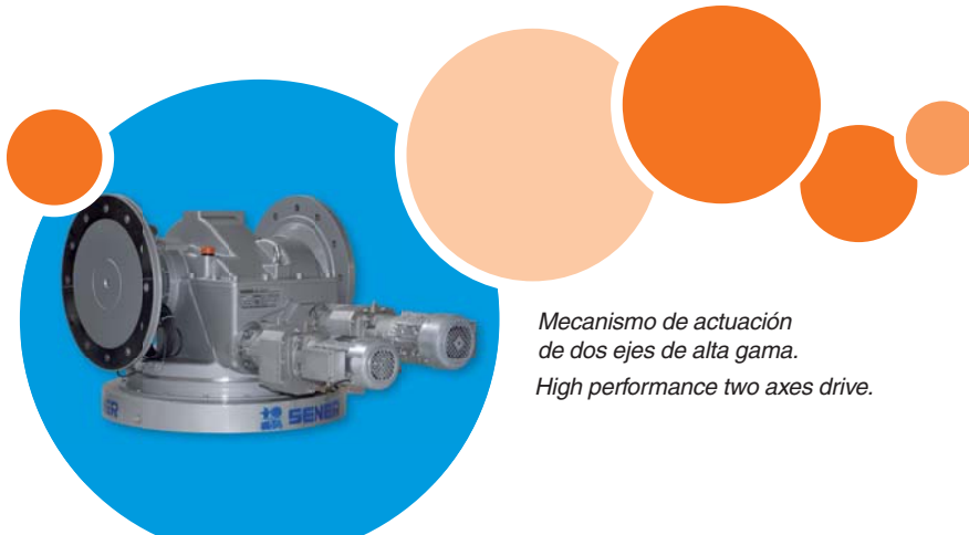
Mecanismo de actuación de dos ejes de alta gama.

It is an installation that has 2,650 heliostats in a field of 185 hectares and has 19.9 MW of generating power and during 15 hours the plant is able to continue generating electricity when there is no sunlight and will be capable of providing 25,000 households with safe, clean energy and also reduce CO 2 emissions by over 30,000 tons per year.