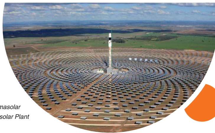
Planta Gemasolar Gemasolar Plant