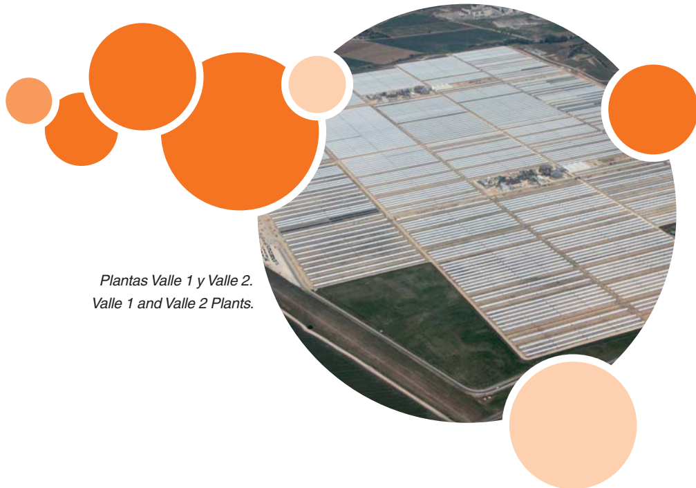
Plantas Valle 1 y Valle 2. Valle 1 and Valle 2 Plants.

Estos proyectos dispondrán de los innovadores colectores cilindro parabólicos, denominados SENERtrough, y de un revolucionario sistema de almacenamiento de calor en sales fundidas, desarrollado por SENER, que permite que las plantas funcionen hasta 7,5 horas sin luz solar. En Valle 1 y Valle 2, los 50 MW de cada planta suministrarán electricidad a 40.000 hogares y evitarán anualmente la emisión de 45.000 toneladas de CO 2 .